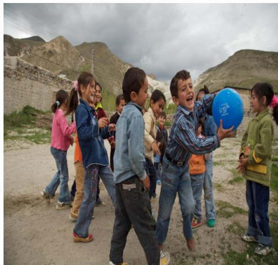
منبع: پرستاری ونگ و پزشکی نلسون

دنیای امن و قشنگ حق طبیعی کودکان است، این یک هدیه ی خدادادی است، پس آنرا از کودکان نگیریم